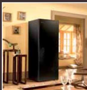
Caves à vins - Gamme Première Wine Cabinets - Première Range