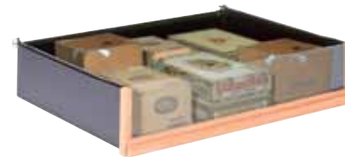
Tiroir de rangement Storage drawer

La Cave à Cigares est étudiée pour être évolutive. Plusieurs types de rangements vous sont proposés pour répondre au mieux à vos besoins.