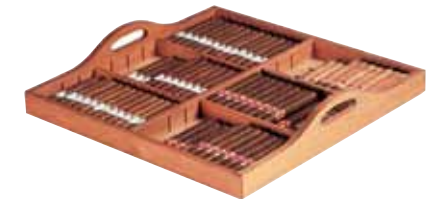
Plateau de présentation sur clayette coulissante (en bois exotique imputrescible). Presentation tray on sliding rack (in rot-proof exotic wood).