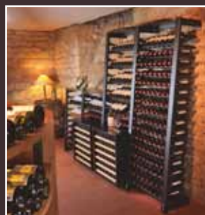
Rangements et Climatiseurs de Cave Storage Systems & Cellar Conditioners